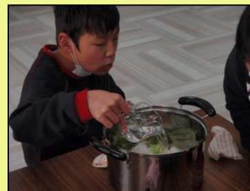
お湯を入れてあとは煮こむだけ!