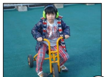
屋上には自転車広場