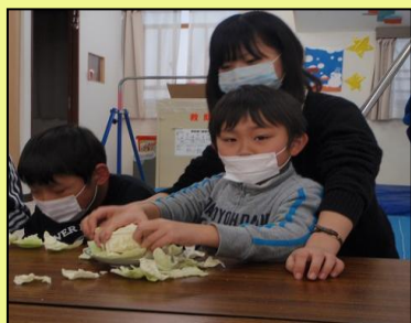
にんじんの皮むき(右)と キャベツちぎり(左)