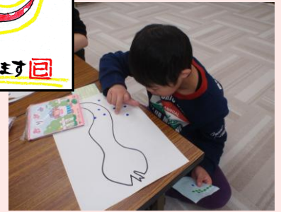
ぬりぬり♪パタパタ♪

にこにこのお正月準備は年が明ける前の制作活動から始まりました。へび年ということで、へびの形に縁取った紙に子どもたちは思い思いに色を塗り、折り紙を切り貼りし、シールを貼り、オリジナルのへびがたくさんできました。そしてできたみんなの作品を職員で編集をし、年賀状に！年明けにご家庭やボランティアさんたちに、感謝の気持ちを込めて出すことができました。